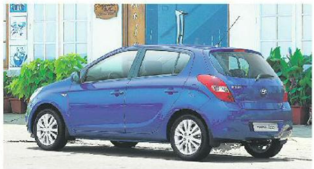
BILD DER HYUNDAI

Der Hyundai i20 ersetzt ab 23. Januar den Getz. Das dritte Modell der i-Reihe gibts schon ab 15 990 Franken.