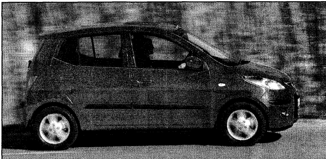
La petite i10 déploie toute la grâce qui faisait défaut à sa devancière, la Hyundai Atos. LDD