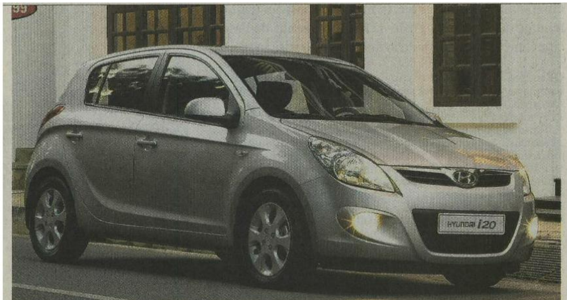
HYUNDAI i20 Questa erede della Getz si rivela una bella sorpresa. Riesce infatti ad essere una compatta capace di offrire comfort, grinta, guidabilità, economicità e spazio. Il bagagliaio ha una capacità massima di 1.060 litri.