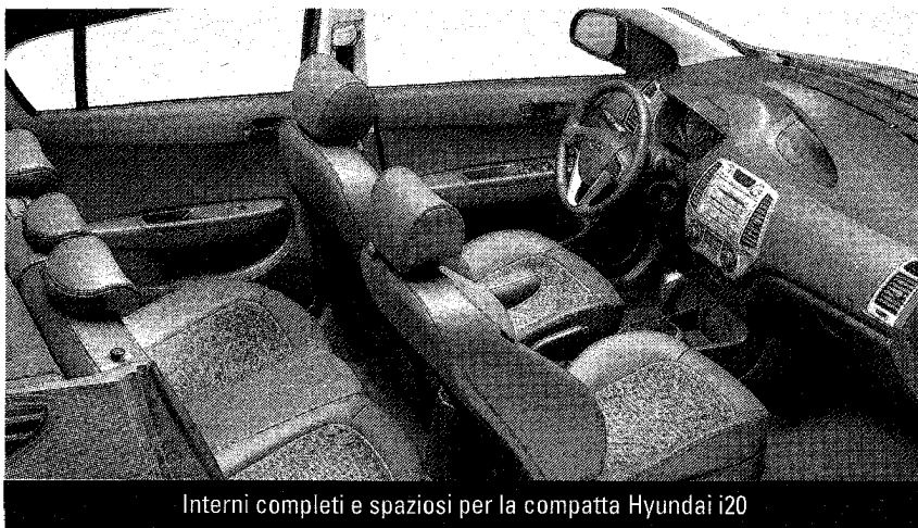
Interni completi e spaziosi per la compatta Hyundai i20