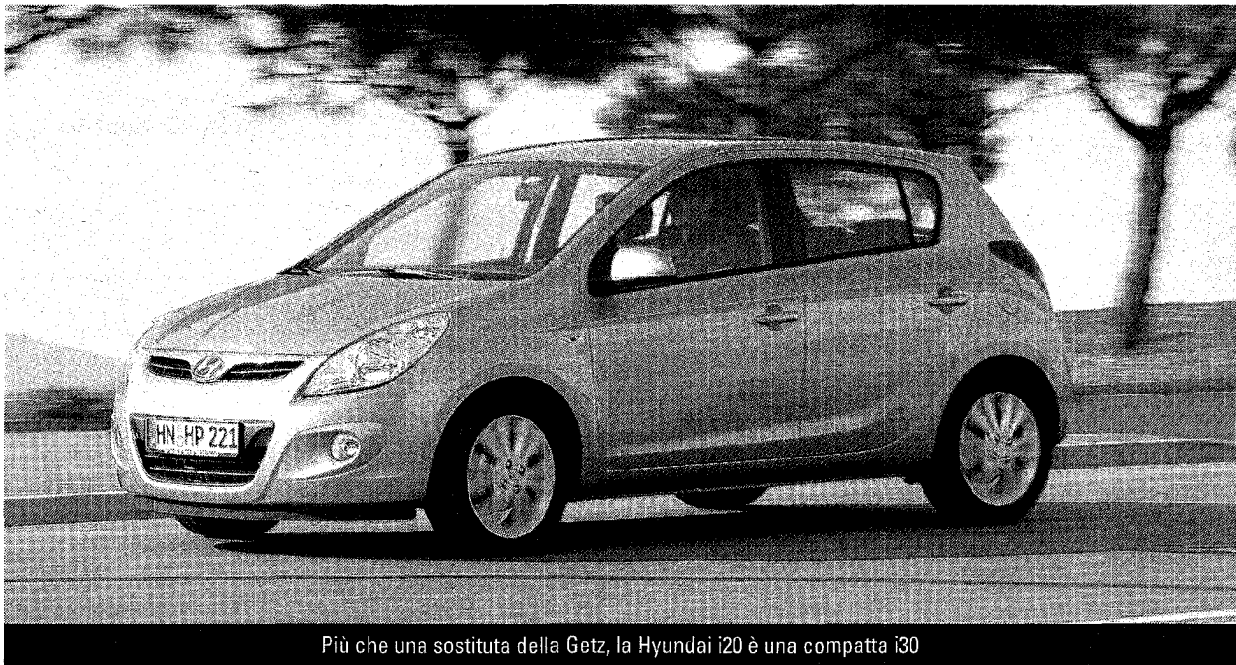
Più che una sostituta della Getz, la Hyundai i20 è una compatta i30

massima di 260 Nm. Su questo aggregato Hyundai monta pure di serie il filtro antiparticolato. La casa coreana, quindi, punta, per la i20, su una gamma di motori performanti ma parchi nei consumi e rispettosi dell'ambiente. I prezzi della i20: versione Confort 1,2 litri benzina a 15'990; versione Style 1,4 litri cambio manuale 19'990 (automatico 21'490); versione Premium 1,6 litri cambio manuale 23'990 (25'490 con cambio automatico). Per la versione Premium con il motore diesel il prezzo è di 26'890 franchi. ESSE